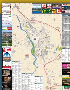
Plan de l'agglomération